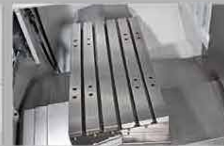
Environnement de travail