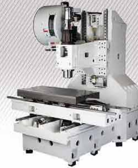
Base mécanique Xenon 1050