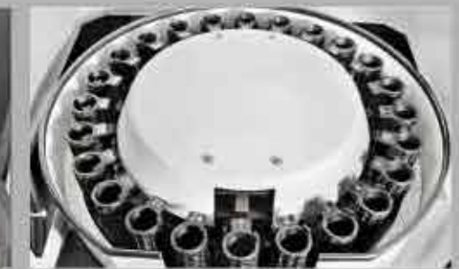
Magasin d'outils RANDOM