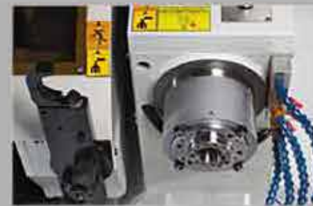
Broche et changeur d'outils