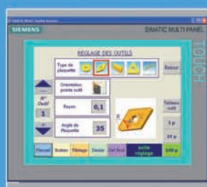
Pupitre tactile | Touch screen panel