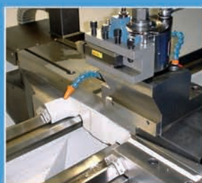
Large banc à 2 Vés de guidage | Large bed with 2 V-slides