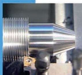
Réparation de filetage | Thread repair function