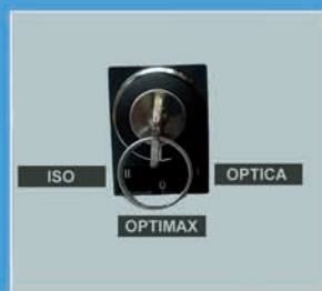
3 modes d'usinage | 3 machining modes