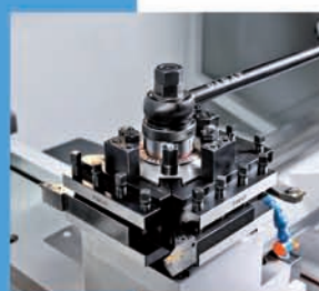
Tourelle 4 positions (option) | 4 position turret (option)